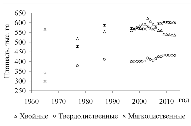
Рис. 1. Динамика площадей хвойных, твердолиственных и мягколиственных пород деревьев

представленных следующими лесообразующими породами: сосна, ель, пихта, лиственница, кедр корейский. По данным учета лесного фонда на начало 2014 г. [3], площадь насаждений из хвойных пород осталась в целом на уровне 1965 г. Вместе с тем, начиная с 2004 г., в ЕАО наблюдается сокращение площади хвойных насаждений. Площади насаждений из твердолиственных (дуб высокоствольный, ясень, клен, вяз и другие ильмовые, береза каменная) и мягколиственных (береза, осина, ольха серая, липа, тополь, ивы древовидные) пород за 1965–2013 гг. увеличились в 1,3 и 2 раза соответственно. По-видимому, в ЕАО продолжается многолетняя тенденция замещения хвойных пород лиственными (замены площади хвойных насаждений на площадь лиственных), в основном в результате рубок хвойных деревьев и лесных пожаров в хвойных и хвойно-широколиственных лесах [3, 7].