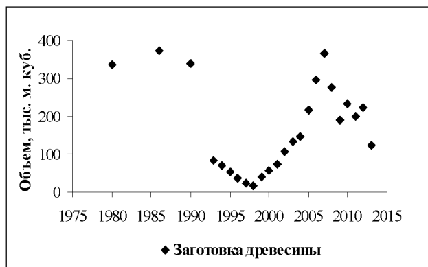
Рис. 2. Динамика объема вырубленной ликвидной древесины при рубках леса главного пользования

Зарастающие рубки леса являются местами обитания многих животных. На вырубках охотничьего типа обитают те же виды животных, что и в елово-пихтовых или лиственных лесах, на месте которых они возникли. К ним относятся лось, изюбрь, косуля, соболь,